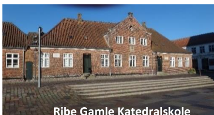
Ribe Gamle Katedralskole