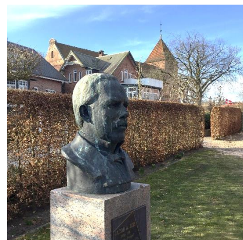
Buste af J. A. Riis ved Ribe Å

Og i 2019 indrettede Sydvestjyske Museer et absolut seværdigt museum over ham i familiens lejlighed i Sortebrødregade.